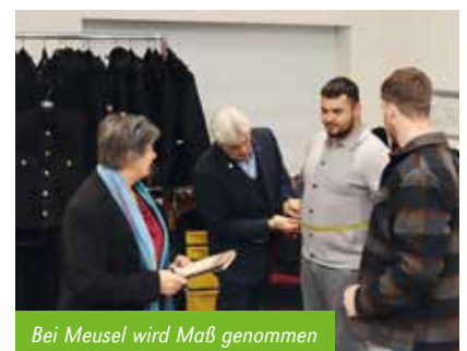
Bei Meusel wird Maß genommen