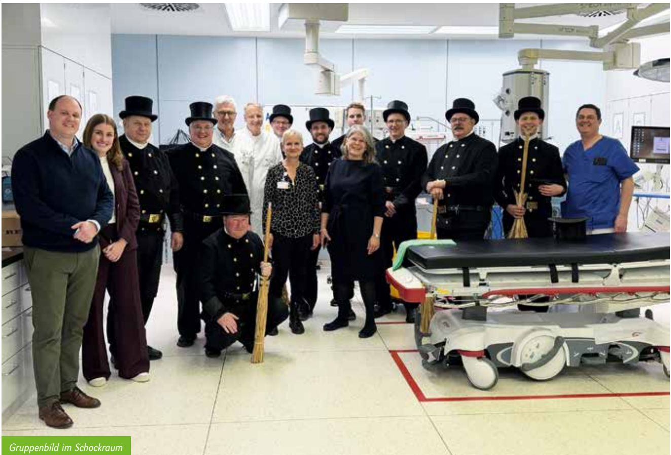
Gruppenbild im Schockraum