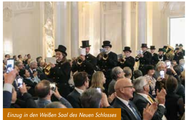
Einzug in den Weißen Saal des Neuen Schlosses