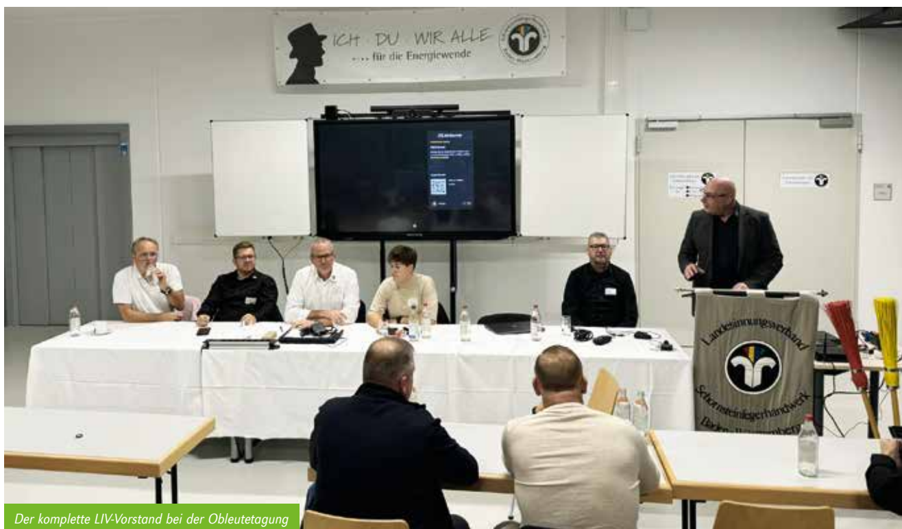
Der komplette LIV-Vorstand bei der Ablettagung