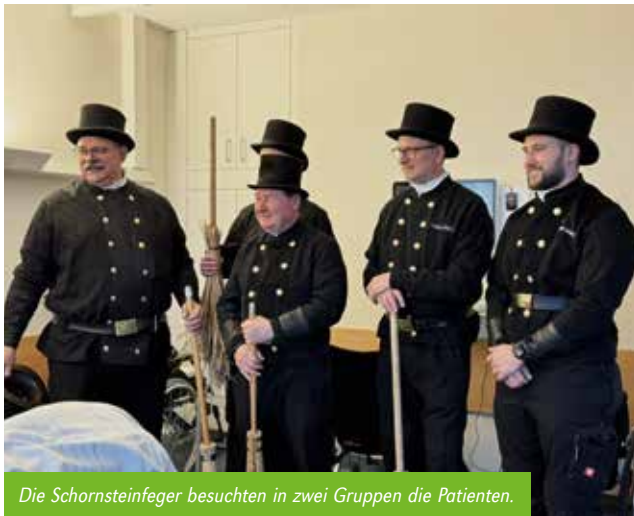
Die Schornsteinfeger besuchten in zwei Gruppen die Patienten.