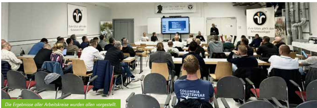
Die Ergebnisse aller Arbeitskreise wurden allen vorgestellt.