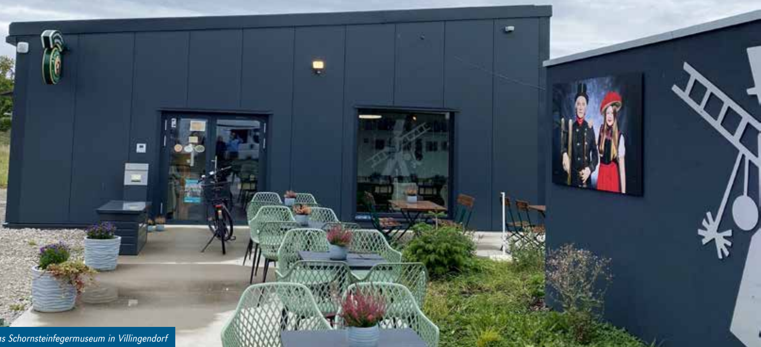
Das Schornsteinfegermuseum in Villingendorf