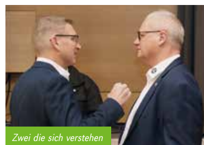
Zwei die sich verstehen