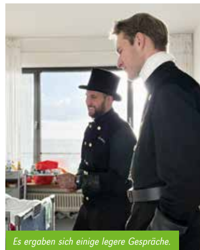
Es ergaben sich einige legere Gespräche.