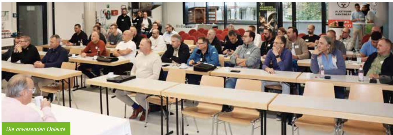
Die anwesenden Obleute