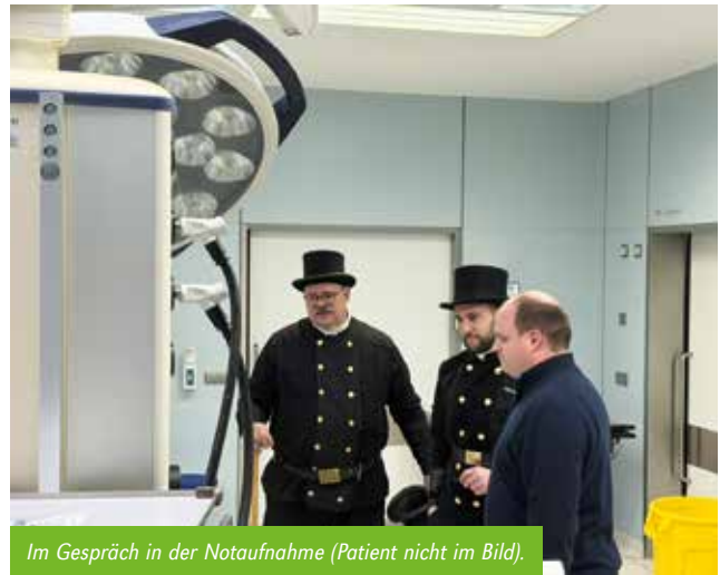
Im Gespräch in der Notaufnahme (Patient nicht im Bild).