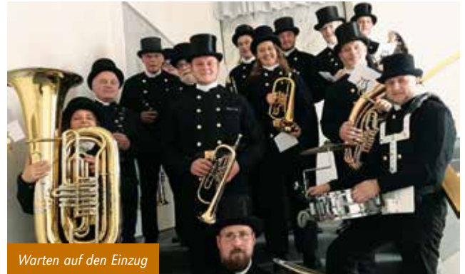
Warten auf den Einzug