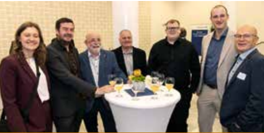
Die musizierenden Kollegen freuten sich auf den Auftritt.