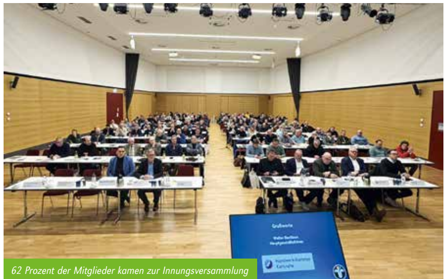
62 Prozent der Mitglieder kamen zur Innungsversammlung