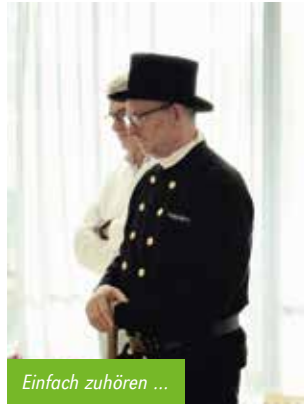
Einfach zuhören ...