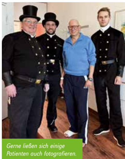
Gerne ließen sich einige Patienten auch fotografieren.