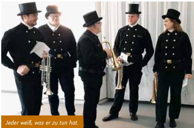
Jeder weiß, was er zu tun hat.