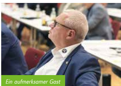
Ein aufmerksamer Gast

Die 1. BImSchV soll angepasst werden. Insbesondere werden Punkte aus dem LAI-Katalog im Gesetz übernommen werden. Die Norm der Staubabscheider soll