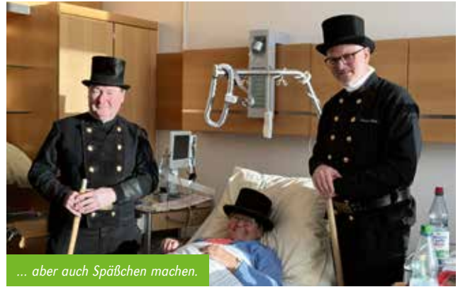
... aber auch Späßchen machen.