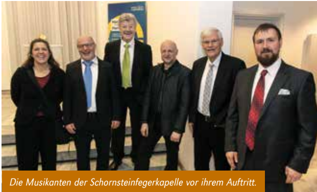
Die Musikanten der Schornsteinfegerkapelle vor ihrem Auftritt.

Mit dabei die Schornsteinfegerkapelle der Innung Freiburg