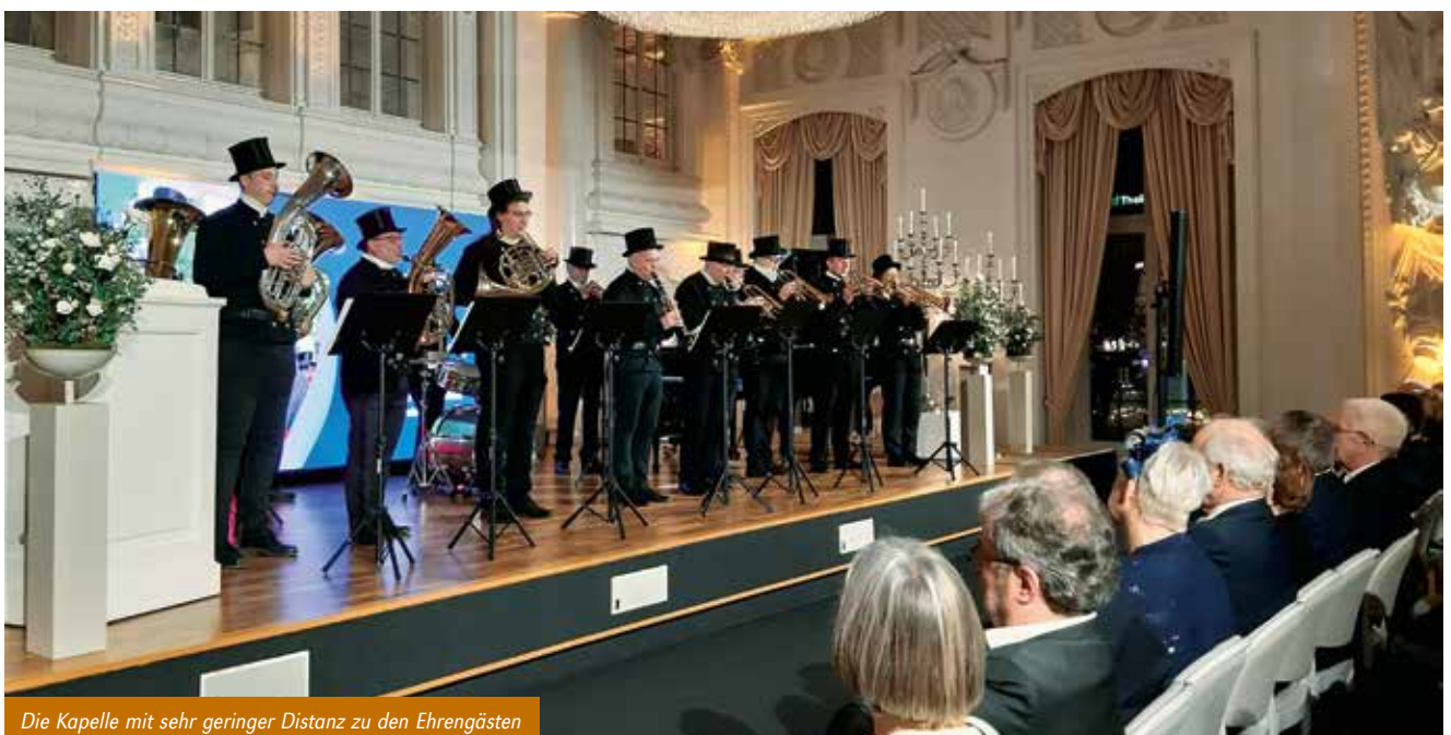
Die Kapelle mit sehr geringer Distanz zu den Ehrengästen