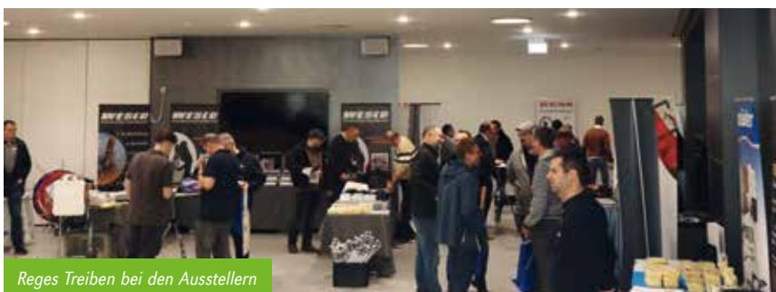
Reges Treiben bei den Ausstellern